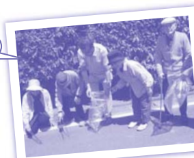
グループホームこすもす