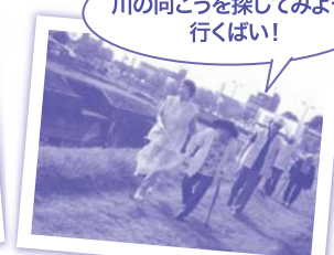
グループホームこすもすII